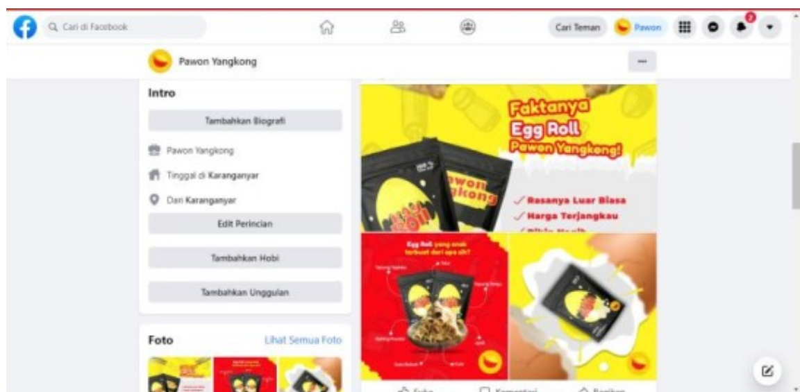
Gambar 2. Screenshoot Konten di facebook